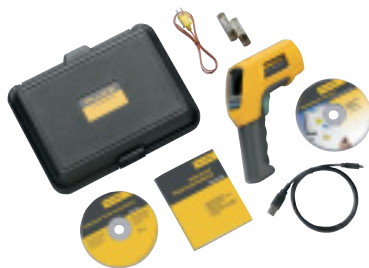
Fluke 568 und enthaltenes Zubehör