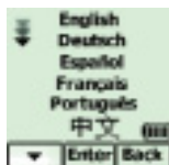
Wählen Sie Ihre Sprache.