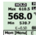
Anzeige aller Messdetails auf einen Blick